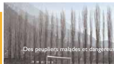
Des peupliers malades et dangereux