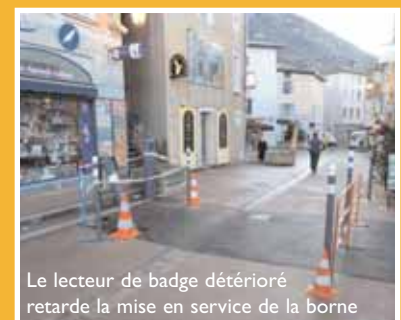
Le lecteur de badge détérioré retarde la mise en service de la borne

Rappelons que l'aménagement de la borne d'accès à la Grande rue vise à conforter le caractère piétonnier de la Grande rue et répond aux besoins exprimés dans le cadre de la concertation réalisée pour le Plan Local des Déplacements. À ce jour, plus de 70 badges d'accès ont été délivrés.