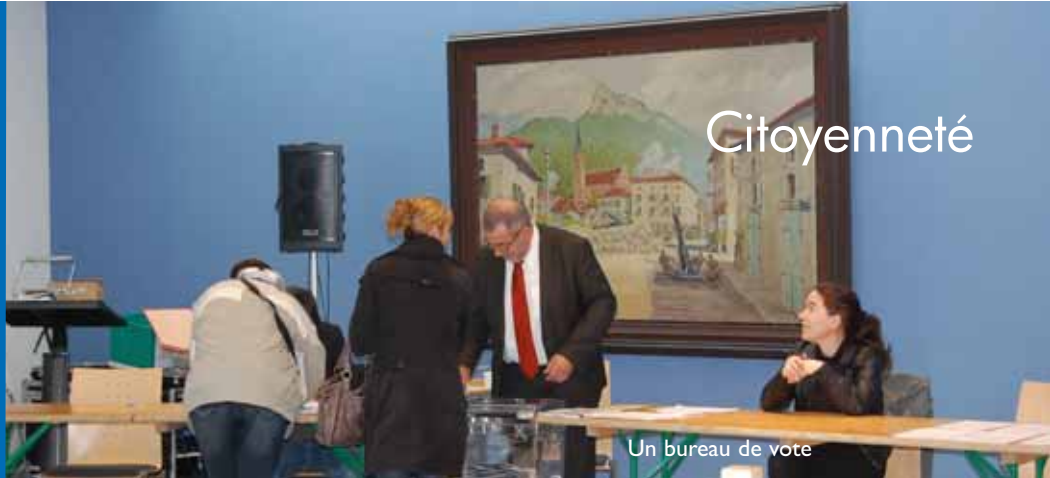
Un bureau de vote

participez aussi aux opérations de vote !