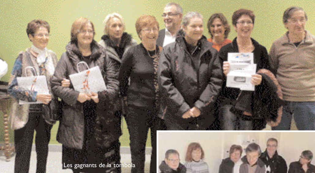
Les gagnants de la tombola