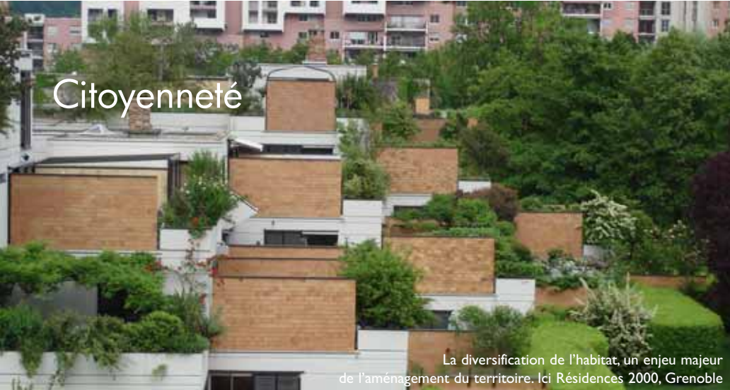
La diversification de l'habitat, un enjeu majeur de l'aménagement du territoire. Ici Résidences 2000, Grenoble