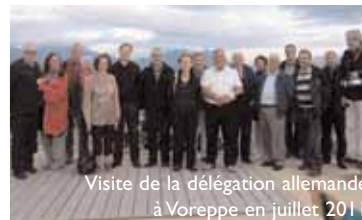
Visite de la délégation allemande à Voreppe en juillet 2011

du Conseil municipal des enfants et des jeunes, accompagnés de leur parent et des représentants du monde associatif.