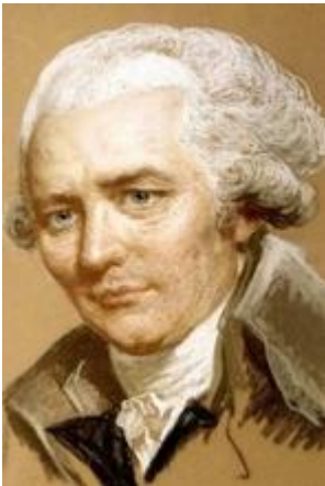
[5] Choderlos de Laclos (1740 - 1803) [6]