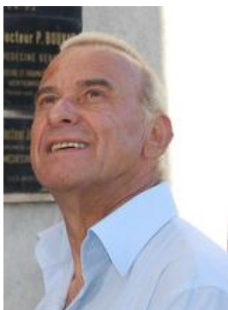
[11] [12] Le chanteur Michel Fugain [13] a passé une grande partie de son

Aujourd'hui cette villa est devenue la Médiathèque Stravinski.