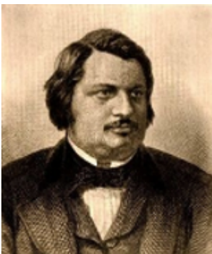
[7] Honoré de Balzac (1799 - 1850) [8]