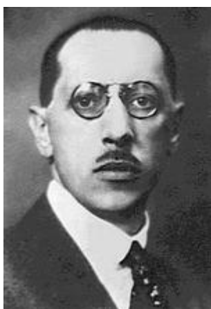
[9] Igor Stravinski (1882 - 1971). [10]

Musicien russe, il vécut quelque temps en tant qu'invité dans la villa de La Veronnière (citée dans Chronique de ma vie par Igor Stravinski).