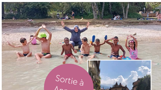
Sortie à Annecy