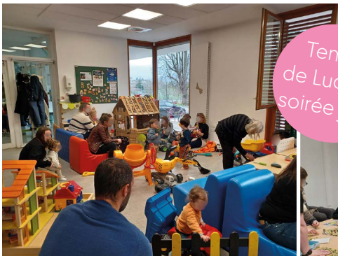
Temps de Ludo et soirée jeux