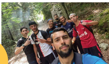
Repas partagé et sortie de l'accueil jeunes