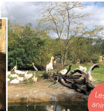
Les parcs animaliers