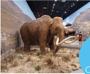
Sortie grotte Chauvet