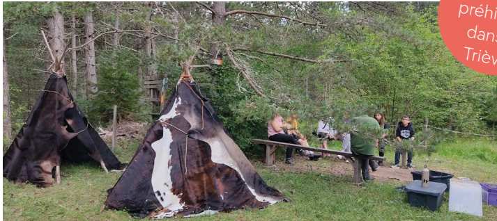
Sortie préhistoire dans le Trièves