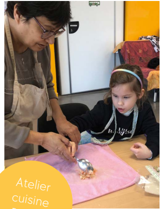
Atelier cuisine Petits/ Grands