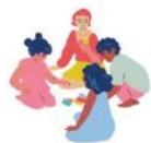
Jouer, rire, s'amuser