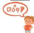
Être incorrect avec les autres